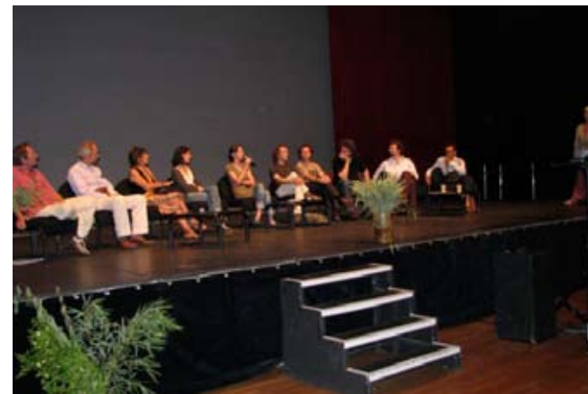
Panel d'acteurs locaux à Bourges le 22 juin

Ces groupes ont pour vocation d'être les témoignages de la démarche de Colibris en offrant localement un espace de rencontre, d'échange et d'action.