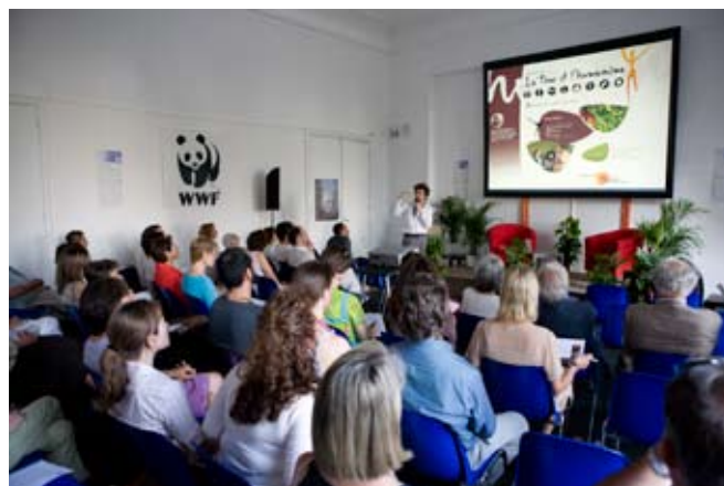
présentation du site au domaine de Longchamp le 1er juillet 2008