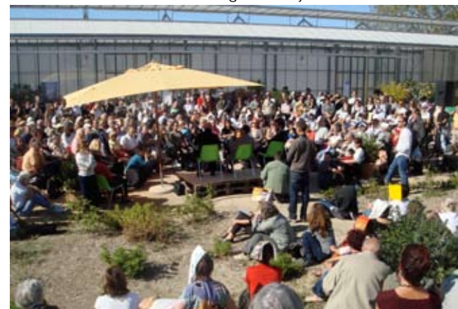
Mouans-Sartoux le 7 octobre