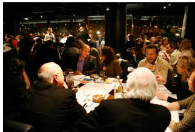
dîner à BIO ART le 28 novembre 2007