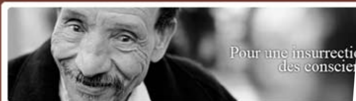
Le blog de Pierre Rabhi