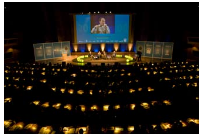
Pierre Rabhi aux Universités de la Terre le 18 octobre 2008